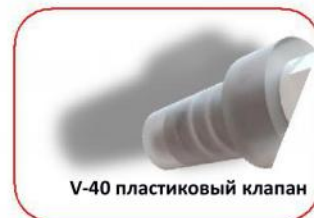
V-40 пластиковый клапан

Разрушающая нагрузка на проушину-2400 Характеристики буя: Твердость по Шору - 66 Прочность на растяжение — 13.7 МПа Удлинение на разрыв — 587% Хладогибкость -33°C Макс. темп. использования +40°C Предельная темп. эксплуатации +50°C Плотность — 1.17г/см куб. Материал буя и проушины — ПВХ Не содержит кадмия